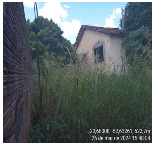
-23,68008, -52,63261, 523,7m 26 de mar de 2024 15:48:04