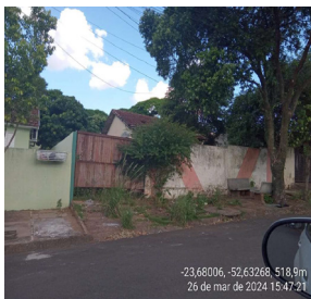
-23,68006, -52,63268, 518,9m 26 de mar de 2024 15:47:21